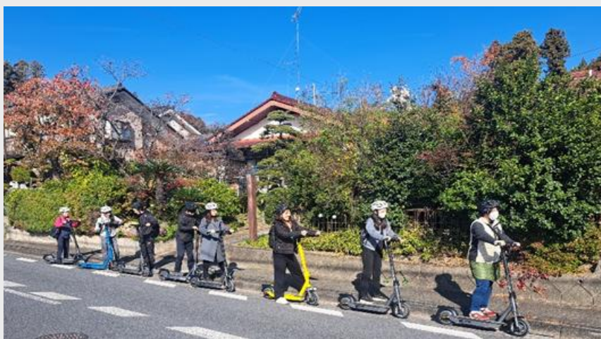
電動キックボードで走行中

自転車とはまた違う非日常感を味わえる電動キックボードに乗ってその地域の自然や食を満喫していただきました。地元でもこのようなツアーを是非開催したい！と嬉しいお声も頂戴しました。