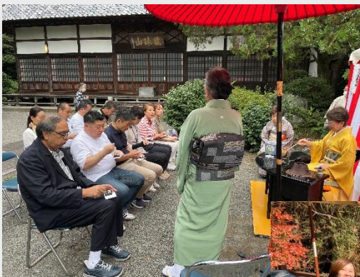
羽村市一峰院にて茶道体験の様子