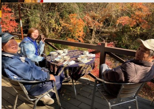
青梅市CAFÉ YUBAにて食事の様子