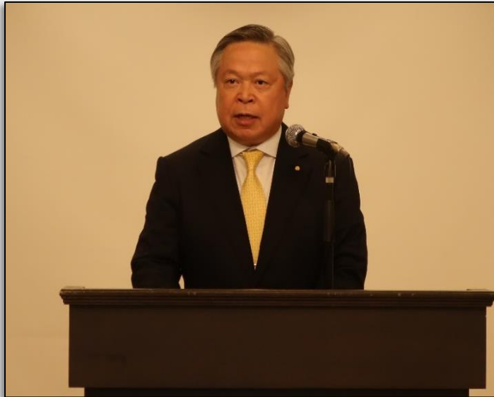
【山下会長による開会挨拶】