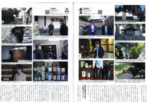
【月間コラムの掲載例】