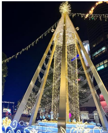
【優秀賞(イルミネーション賞)】