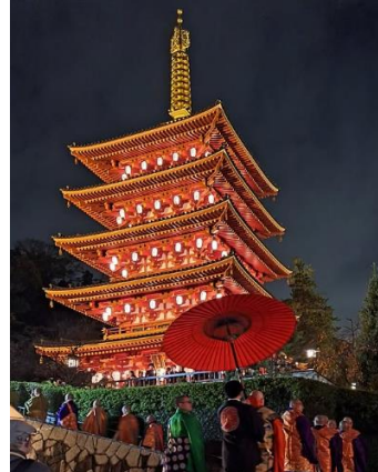
【優秀賞(ライトアップ賞)】