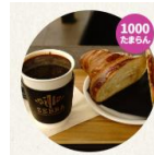
【「たまらんポイント」でもらえる景品例】