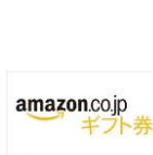
【「総合獲得ポイント」で応募し抽選で当たる景品例】