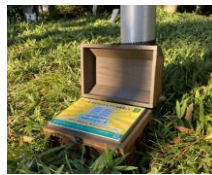
【合言葉が入った宝箱】