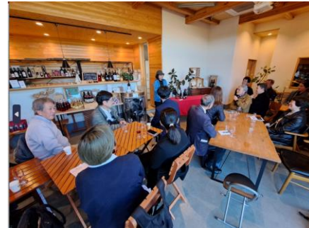
【石川酒造で説明を受ける参加者】