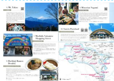
【att.TOKYO TAMA表紙】 【見開きページ一例】