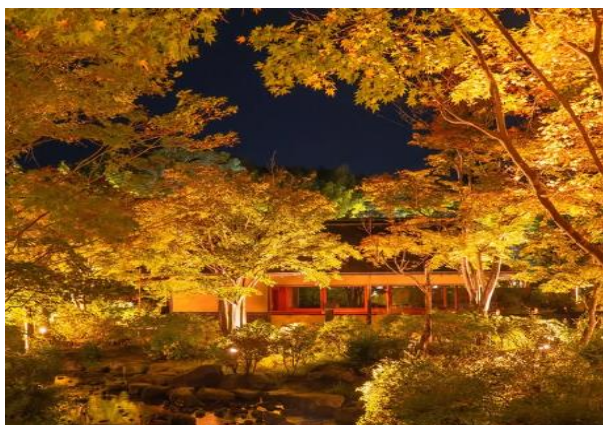
【最優秀賞】昭和記念公園で「秋の夜散歩」

実施期間:2024年8月28(水)～2025年1月17日(金) 応募件数:283件