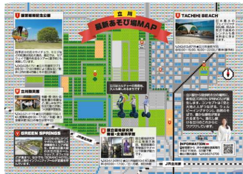
四季の移り変わりを感じる都心のオアシスは、あそび方もいろいろ。お楽しみや、遊んで楽しむ楽しみもいろいろ。最近セグウェイも人気だとか。たまには新しいあそびも楽しみたいという方もいる。