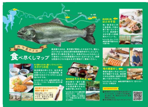
川魚が苦手な人でも大丈夫。奥多摩やまめは特有の高山でもなく、淡白ながらも塩味のある魚をいただくことのできる機会が変わることだけあり、奥多摩まで足を延ばして、食と旅を満喫する一日。