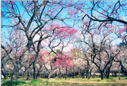
谷保天満宮の梅（国立市）