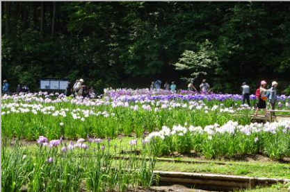
吹上しょうぶ公園のハナショウブ（青梅市）

交通安全・学業成就のパワースポットとして知られる国立市の谷保天満宮。境内には約350本の梅の木が育ち、1月中旬から3月にかけては紅白の梅を楽しむに多くの花見客が訪れます。